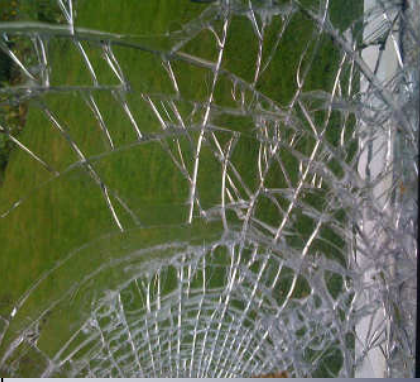
Die Folie hält das Glas zusammen