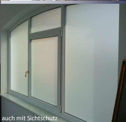
auch mit Sichtschutz